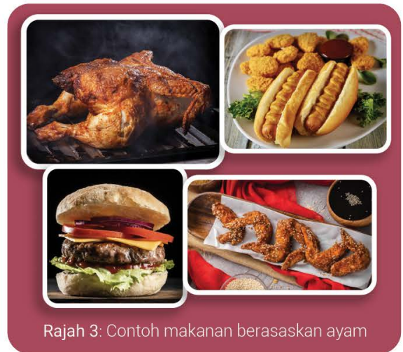
Rajah 3: Contoh makanan berasaskan ayam

Namun begitu, industri ternakan ayam terdedah kepada banyak faktor yang boleh mempengaruhi untung-rugi dan daya maju pengusaha. Antaranya adalah ketidakstabilan harga pasaran, harga input seperti makanan dan bahan binaan, cuaca yang berubah-ubah dan penyakit. Ayam juga memerlukan persekitaran yang selesa untuk pertumbuhan yang cekap. Pemeliharaan ayam memerlukan perancangan yang teliti bermula daripada peringkat penubuhan ladang, pengurusan sehinggalah ke pemasaran.