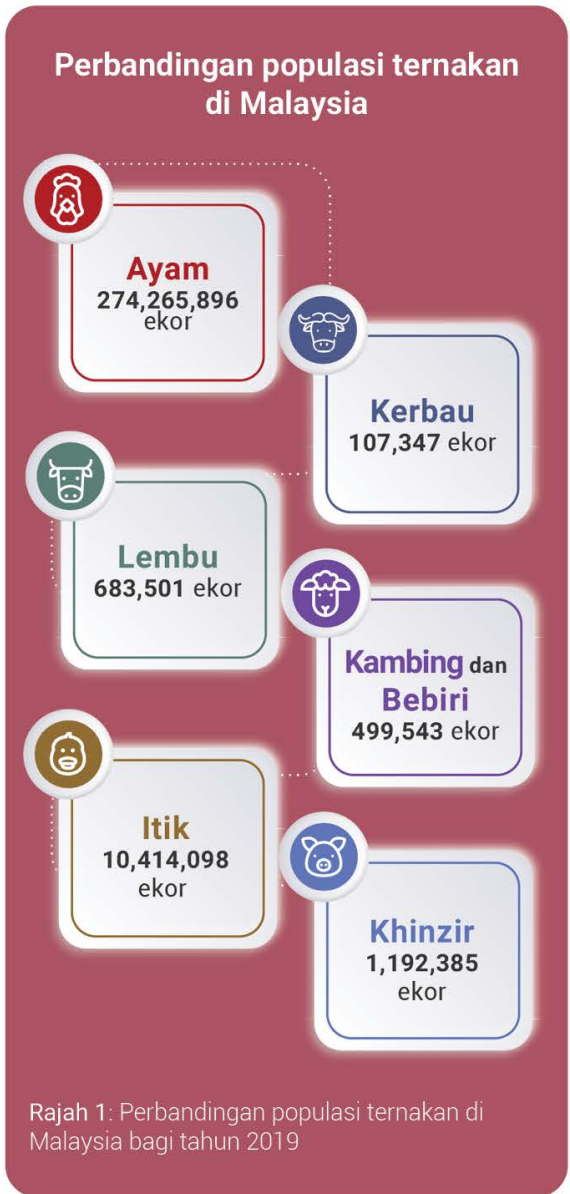
Rajah 1: Perbandingan populasi ternakan di Malaysia bagi tahun 2019

Jabatan Perkhidmatan Veterinar di bawah Kementerian Pertanian dan Industri Makanan bertanggungjawab secara terus dalam memastikan bekalan ayam di dalam negara mencukupi serta keselamatan makanan terjamin. Ternakan ayam meliputi pelbagai kategori seperti ayam pedaging, ayam penelur, ayam kampung, ayam pembiak baka dan sebagainya. Memandangkan industri ternakan ayam merupakan industri ternakan terbesar dijalankan di Malaysia iaitu lebih 95% bilangan ternakan adalah ayam. Berikut merupakan data mengenai industri ternakan ayam di Malaysia yang dikeluarkan oleh Jabatan Perkhidmatan Veterinar, Malaysia.