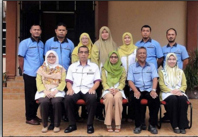
Kumpulan Inovasi KTS Kelantan

Gambar / Ilustrasi sebelum / selepas pelaksanaan projek dan gambar yang berkaitan