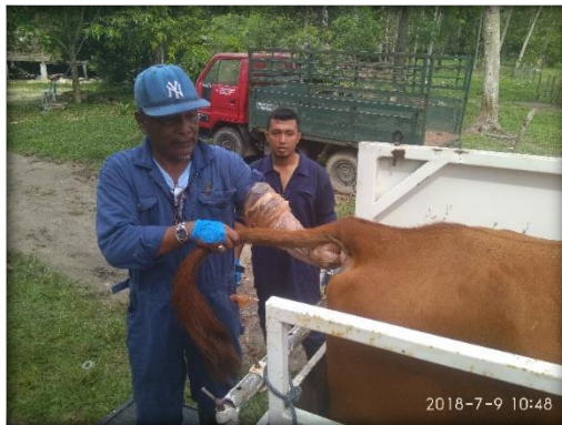
Pemeriksaan Kebuntingan dan AI