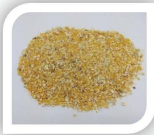
■ Jagung Hancur