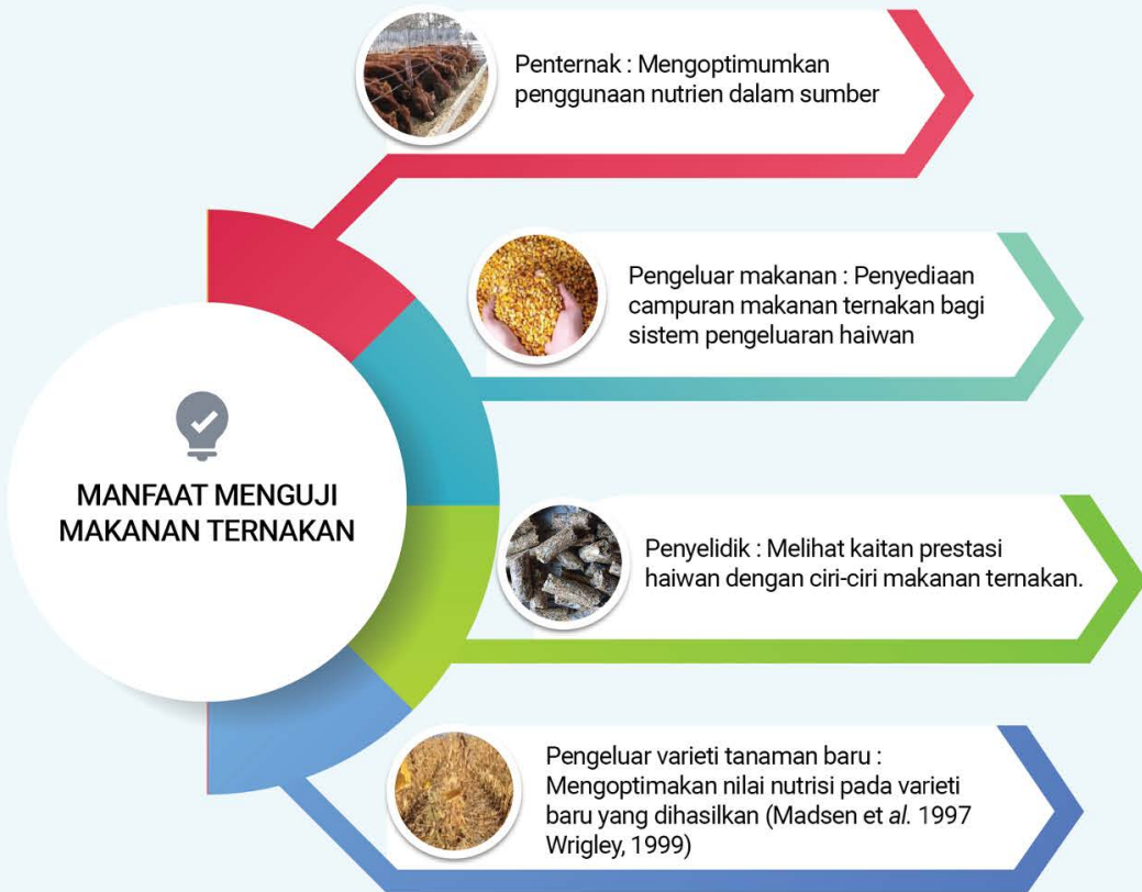
Rajah 2 : Manfaat Menguji Makanan Ternakan

Sampel dalam kategori ini merupakan semua jenis tumbuhan dan hijauan sama ada dalam bentuk segar mahupun kering. Rufaj merangkumi lebih dari 50% daripada semua bahan makanan yang diberi kepada ternakan. Secara teknikal, rufaj/foraj/rumput merujuk kepada makanan ternakan dengan kandungan serat yang tinggi. Contoh sampel kategori rufaj/foraj/rumput yang kerap diuji adalah seperti rumput Napier, rumput Guinea, daun petai belalang, Azolla , pelepah sawit, batang jagung, rumpai, silaj, hay dan pelbagai lagi.