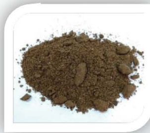
■ Palm Kernel Expeller

Terdapat beberapa jenis bahan mentah utama yang dijadikan bahan makanan ternakan iaitu bijirin, produk sampingan bijirin dan produk sampingan industri pertanian. Contoh jenis bijirin adalah seperti jagung (pelbagai gred), soya, gandum, sorghum, beras dan lain-lain. Sekam gandum, sekam padi, sekam soya, hampas barli pula antara contoh produk sampingan bijirin. Produk sampingan industri pertanian antaranya adalah palm kernel cake (PKC), palm kernel meal (PKM), palm kernel expeller (PKE), hampas sagu, hampas kelapa kulit ubi kayu dan molas.