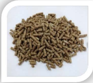
■ Pelet Lembu Tenusu