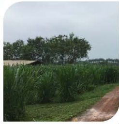
■ Rumput Napier