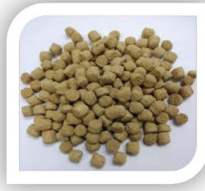
■ Pelet Kuda

Bahan campuran merupakan makanan ternakan yang telah diformulasi dan dipelletkan untuk tujuan komersial. Makanan ternakan jenis ini diformulasi untuk memenuhi keperluan nutrien ternakan mengikut jenis dan umur yang disasar disamping kos yang telah dioptimumkan. Walaupun makanan ternakan jenis ini dibeli dalam pakej yang dilabel dengan lengkap, ia masih perlu diuji/dianalisis untuk memastikan ternakan menerima nutrien yang mencukupi. Contoh bahan campuran adalah pelet bebiri, pelet kambing, pelet lembu tenusu dan lain-lain.