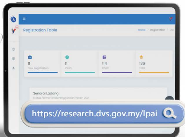
Rajah 1: Muka depan antara muka sistem atas talian DVS LPAI H9N2