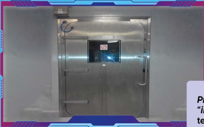
Pneumatic Door - Berfungsi secara "interlocking" bagi mengawal tekanan udara di dalam makmal