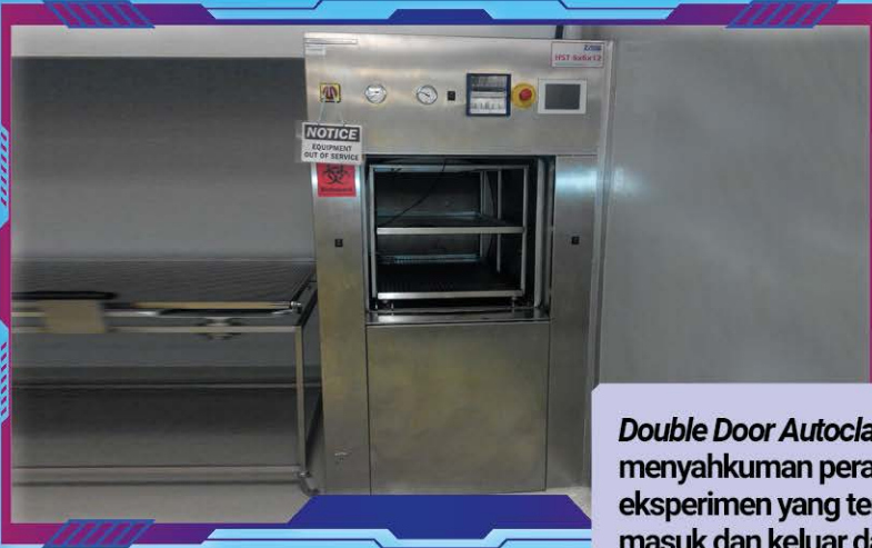
Double Door Autoclave – Berfungsi untuk menyahkan peralatan dan bahan eksperimen yang tercemar sebelum dibawa masuk dan keluar dari makmal Tahap 3