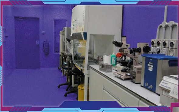
Makmal BSL 2