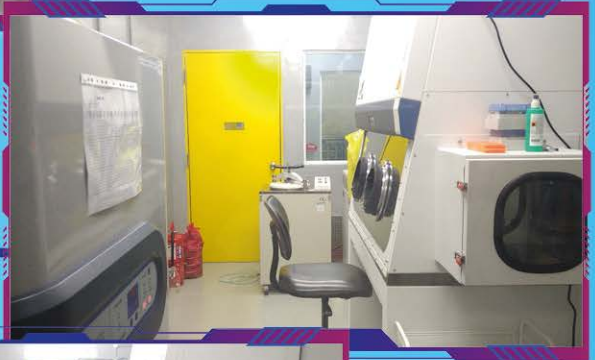
Makmal BSL 3