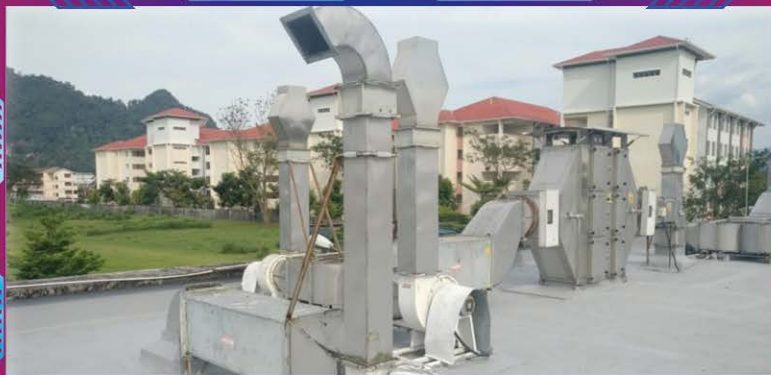
Exhaust HEPA Filter – Berfungsi untuk menapis udara tercemar dari makmal Tahap 3 sebelum dilepaskan ke persekitaran