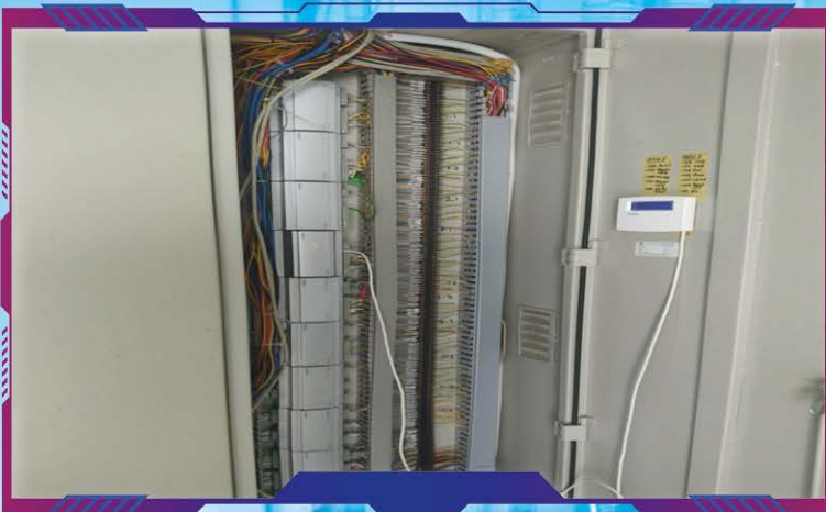
Sistem Automasi Bangunan