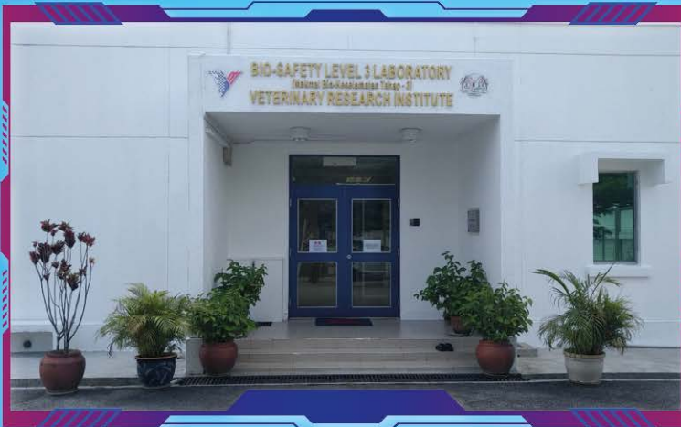
Pintu masuk Fasiliti Bio-keselamatan Tahap 3

Pada masa ini, antara kolaborasi penyelidikan yang dijalankan melibatkan fasiliti BSCL-3 adalah penyelidikan penghasilan Vaksin Covid-19 dengan kerjasama Institut Penyelidikan Perubatan (IMR), Universiti Putra Malaysia (UPM) dan VRI.