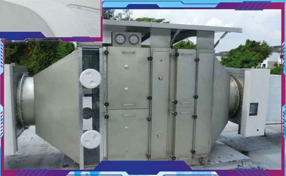
Air Supply HEPA Filter - Berfungsi untuk menapis udara yang masuk ke Bilik Eksperimen Haiwan