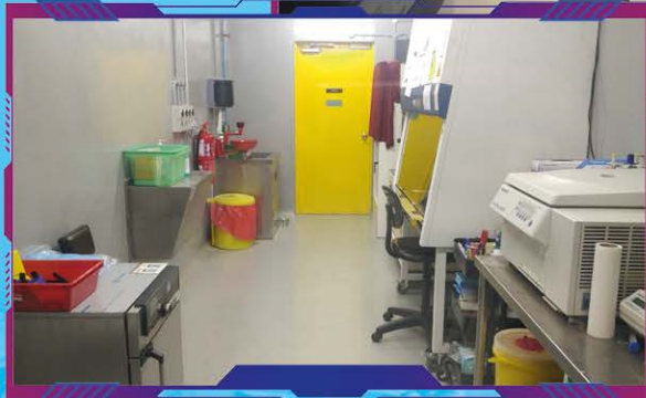
Makmal BSL 3