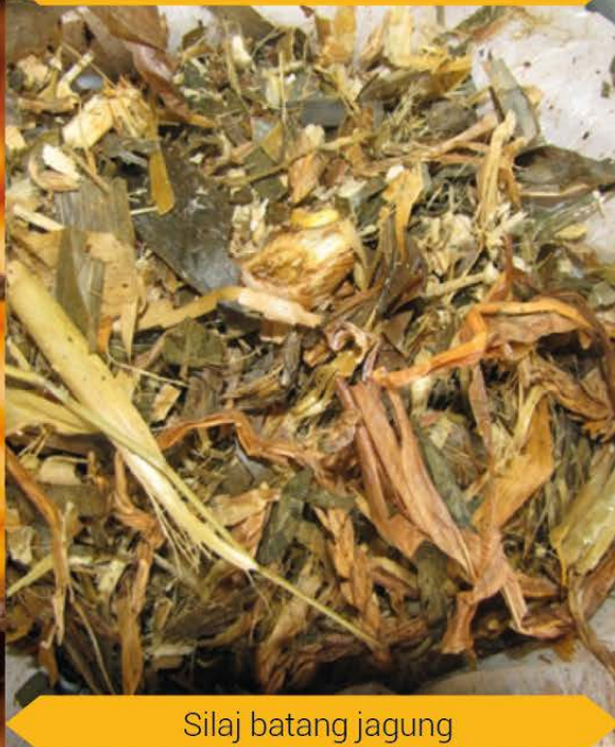
Silaj batang jagung