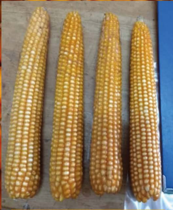
Jagung bijian yang ditanam IVM