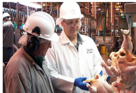
Pemeriksa veterinar melakukan pensampelan di loji pemprosesan ayam

Program Pemeriksaan Loji dan Rumah Sembelih Serta Pengujian Residu Drug oleh DVS Pelbagai hasil kajian menunjukkan masih terdapat sisa ubat-ubatan veterinar pada produk hasil ternakan ayam, itik, lembu dan babi seperti susu, telur, daging dan organ dalaman. Program pemeriksaan di loji pemprosesan dan rumah sembelih oleh pemeriksa veterinar DVS termasuklah juga ujian makmal ke atas drug veterinar atau penggalak tumbesaran dalam sampel daging dan organ adalah bertujuan untuk mengurangkan risiko pengguna terdedah kepada kimia berbahaya tersebut.