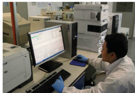
Pengujian sampel di makmal

Jadual 1 menunjukkan hasil laporan pemantauan residu drug veterinar dalam daging ayam, babi dan lembu dari rumah sembelih dan loji pemprosesan ayam di Semenanjung Malaysia yang telah dijalankan oleh DVS sepanjang tahun 2013 hingga 2017. Sebanyak enam kumpulan drug veterinar dari 8,708 sampel telah diuji iaitu tetracyclines, sulphonamides dan quinolones termasuk 3 drug yang diharamkan di Malaysia iaitu chloramphenicol, nitrofurans dan \beta -agonist. Beberapa drug baru turut diuji pada tahun 2017 iaitu kumpulan anticoccidial, stilbenes dan nitroimidazoles. Sebanyak 180 sampel dari 8,708 keseluruhan sampel hasil ternakan dikesan dengan sekurang-kurangnya satu jenis residu drug veterinar (2.1%). Peraturan kadar pelanggaran adalah 0.8% (tahun 2014) ke 3.1% (tahun 2010).