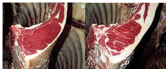
dengan β-agonist tanpa β-agonist

Penggunaan β-agonist dilaporkan dapat mengurangkan lemak dan meningkatkan muscle