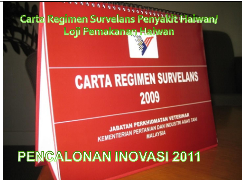
Carta Regimen Survelans 2009