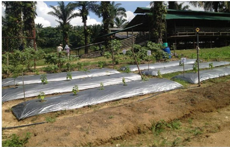
6 plot/batas di tanam dengan sayuran