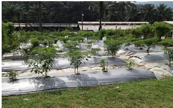
Tanaman sayuran yang tumbuh lebat pada lawatan kali kedua