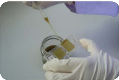
Rajah 7 : Teknik McMaster untuk mengira telur cacing