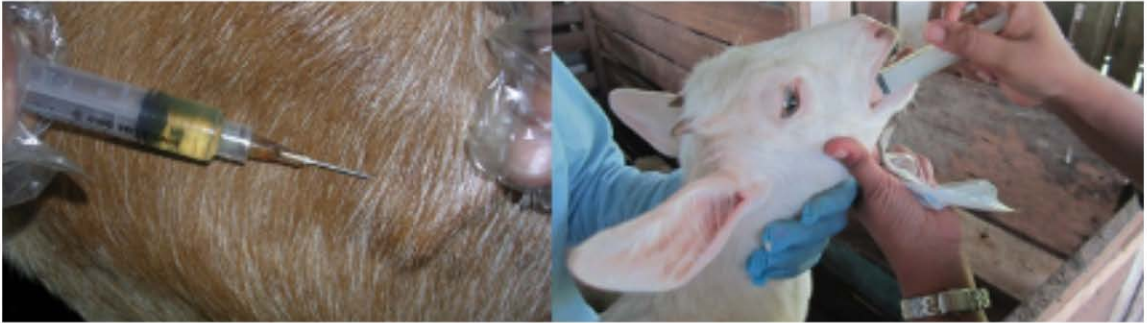
Rajah 6 : Pemberian ubat cacing pada ternakan secara sub cutaneous atau oral teknik ujian dalam makmal