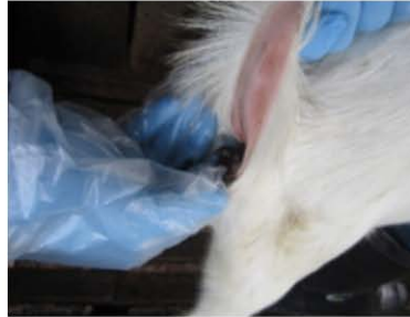
Rajah 4 : Sampel tinja di ambil daripada rektum