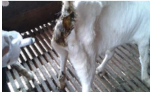
Rajah 1 : Masalah kecacingan boleh menyebabkan tinja cair ( diarrhea )

Pemberian ubat cacing merupakan kaedah pengawalan yang paling popular dalam kalangan penternak kambing dan bebiri di Malaysia untuk mengawal kecacingan. Pemberian ubat cacing yang kerap dan tidak betul menyebabkan cacing menjadi rintang terhadap ubat cacing dan pemberian ubat cacing akan merugikan penternak. Keberkesanan ubat cacing dalam mengawal masalah kecacingan boleh diukur menggunakan kaedah Faecal Egg Count Reduction Test , FECRT (ujian penurunan kiraan telur dalam tinja) pada kambing dan bebiri. Penternak perlu mengetahui keperluan menjalankan ujian FECRT di ladang masing-masing sebagai panduan dalam pemilihan ubat cacing dan kaedah pengawalan cacing. Artikel ini ditulis untuk menjelaskan cara-cara menjalankan ujian FECRT di ladang.