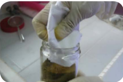
Rajah 8 : Teknik faecal culture untuk mengetahui jenis cacing

Masalah kecacingan perlu diberi perhatian oleh industri ternakan ruminan, terutama ternakan kambing kerana kambing adalah haiwan yang mudah terdedah dengan masalah kecacingan. Salah satu kaedah kawalan masalah kecacingan yang berkesan adalah penggunaan ubat cacing. Namun, penggunaan ubat cacing yang tidak tepat dari segi kekerapan dan dos akan menyebabkan masalah yang lebih besar iaitu kerintangan cacing terhadap ubat cacing.