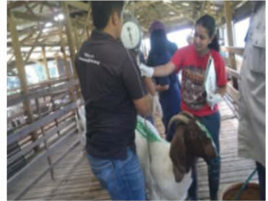
Rajah 5 : Ternakan ditimbang sebelum ubat cacing diberikan