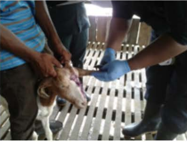
Rajah 3 : Ternakan diberi nombor ID dengan cara tag nama