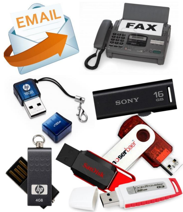
Gambar Produk Inovasi