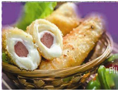
KEBAB AYAM CHEESE ROLL