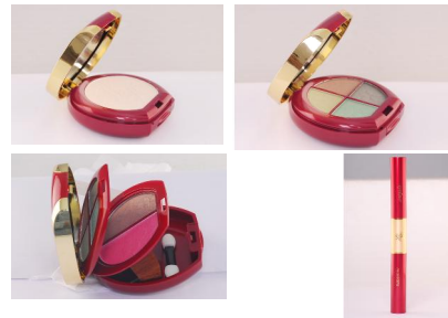
PRODUK KOSMETIK HR