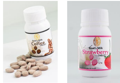
MAKANAN TAMBAHAN KESIHATAN HR