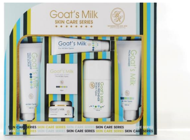
PRODUK PENJAGAAN KULIT HR