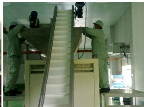
Below Freeze Stamping Technique