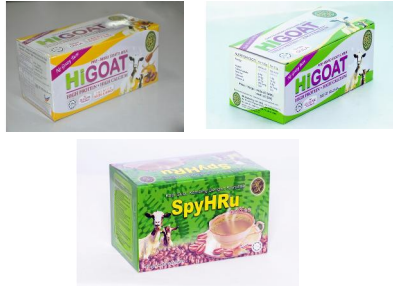
MINUMAN KESIHATAN SUSU KAMBING HR